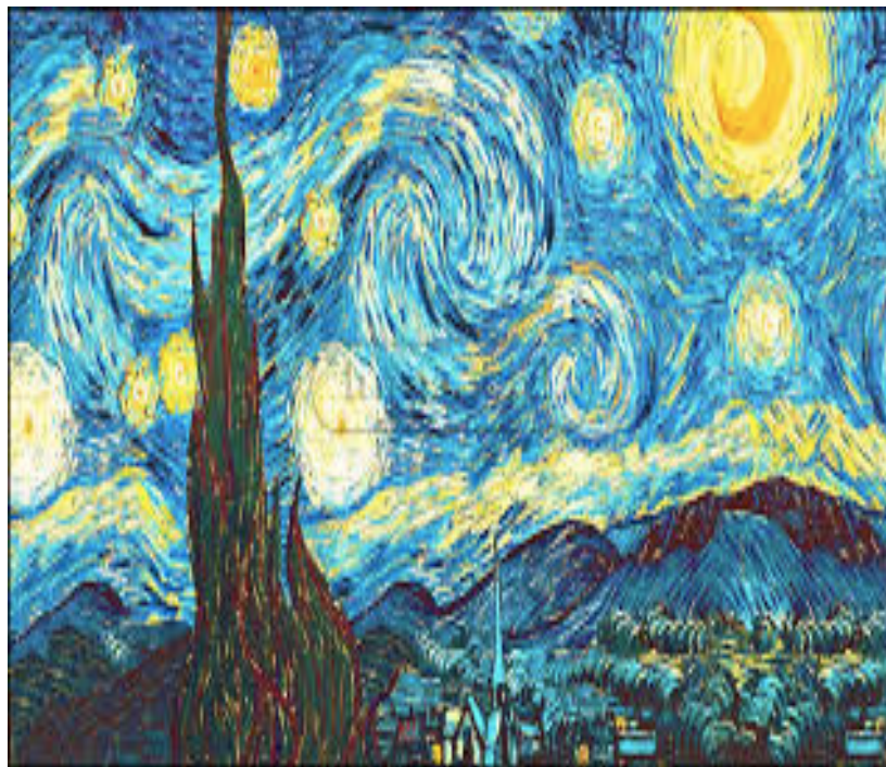
Notte stellata Van Gogh